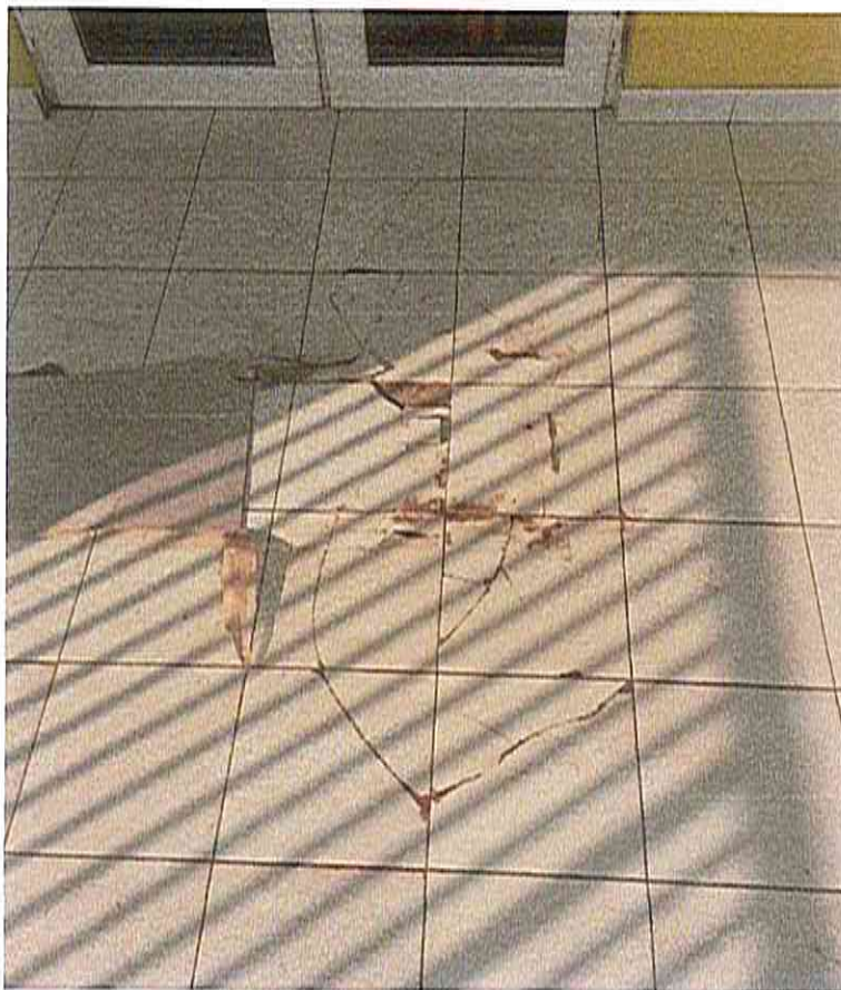
Imagen N°1 Cerámica agrietada.

Las obras son necesarias ya que, en sector mencionado, la cerámica se encuentra fisurada y agrietada en sector de salida a terraza, con bolsones de aire, lo que genera un desprendimiento de cerámica (Ver imagen N°1), se aprecian desniveles (Ver Imagen N°2) y además, esta es para muros y no para pisos, generando un riesgo de caída, tanto para los párvulos y lactantes, como también para personal de establecimiento, con humedad o agua presente.