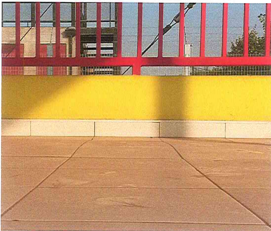
Imagen N°2 Cerámica desnivelada

A Continuación se entregan Los Criterios de Construcción, los cuales son: